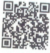
Food Defense- Spanish