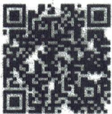
Food Defense- Spanish