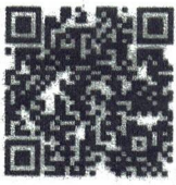
Food Defense- Spanish