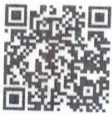
Food Defense- Spanish