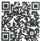
Food Defense- Spanish