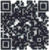
Food Safety- Spanish