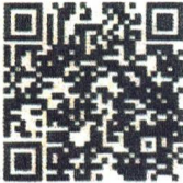
Food Safety- English

He recibido las Políticas y Capacitación en Seguridad Alimentaria, Defensa Alimentaria y Salud e Higiene. Tengo Seguí los códigos QR a continuación y miré los videos de capacitación. Entiendo completamente lo requerido políticas.