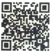
Food Defense- English