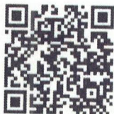
Food Defense- Spanish