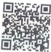
Food Defense- English