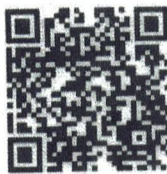
Food Safety- Spanish