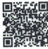
Food Defense- English