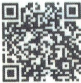
Food Safety- Spanish