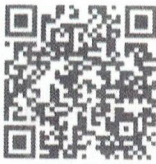
Food Defense - Spanish