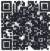
Food Safety- English

He recibido las Políticas y Capacitación en Seguridad Alimentaria, Defensa Alimentaria y Salud e Higiene. Tengo Seguí los códigos QR a continuación y miré los videos de capacitación. Entiendo completamente lo requerido políticas.