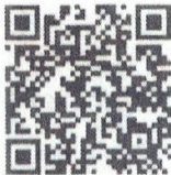
Food Defense- Spanish