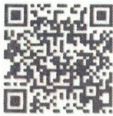
Food Defense- English