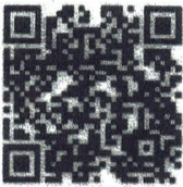
Food Safety- Spanish