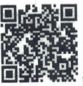
Food Defense- Spanish