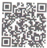
Food Defense- Spanish