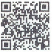
Food Defense- English