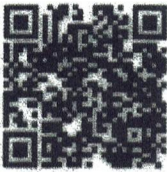
Food Safety- English

He recibido las Políticas y Capacitación en Seguridad Alimentaria, Defensa Alimentaria y Salud e Higiene. Tengo Seguí los códigos QR a continuación y miré los videos de capacitación. Entiendo completamente lo requerido políticas.