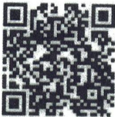
Food Safety- Spanish