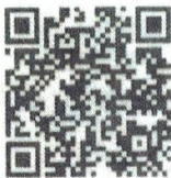
Food Defense- Spanish