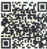
Food Defense- English