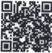
Food Safety- English

He recibido las Políticas y Capacitación en Seguridad Alimentaria, Defensa Alimentaria y Salud e Higiene. Tengo Seguí los códigos QR a continuación y miré los videos de capacitación. Entiendo completamente lo requerido políticas.