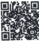
Food Safety- English

He recibido las Políticas y Capacitación en Seguridad Alimentaria, Defensa Alimentaria y Salud e Higiene. Tengo Seguí los códigos QR a continuación y miré los videos de capacitación. Entiendo completamente lo requerido políticas.